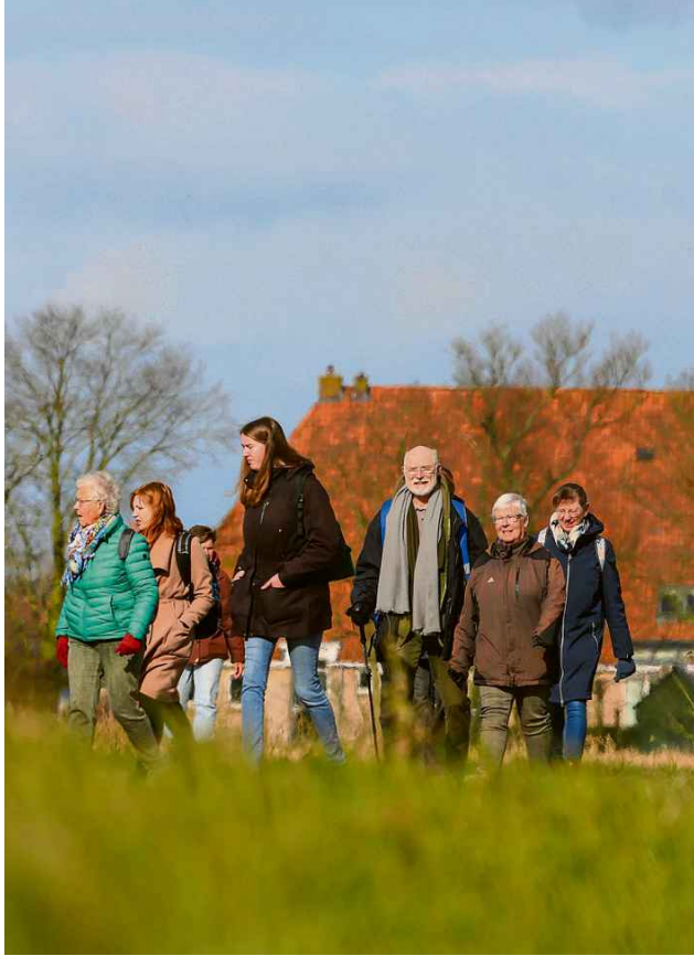
Deelnemers aan de eerste etappe van pelgrimstocht het Zonneliëpad wandelen zaterdag van Jorwert naar Akkrum.

Twee jubilea zijn aanleiding voor de nieuwe pelgrimroute: 800 jaar schreef Franciscus van Assisi zijn Zonnelië en tien jaar geleden publiceerde paus Franciscus zijn belangrijkste encycliciek Laudato Si' , waarin de paus oproept om de schepping te beschermen.