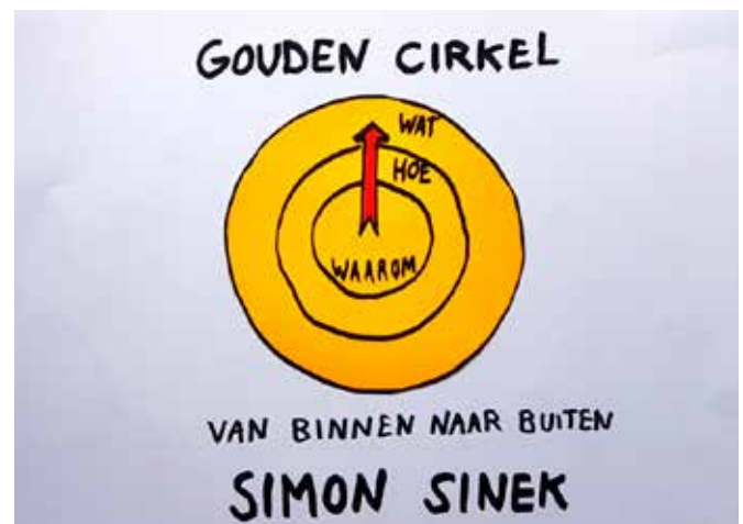
De gouden cirkel van Simon Sinek

Dat is de kortst mogelijke verwoording van het waarom van Nijkleaster. De vis vormt samen met deze woorden het centrum van de kring. Christus is de verpersoonlijking van de woorden 'Ruimte voor God, om mens te worden'. Bij Nijkleaster proberen we ruimte te maken voor God. Dat betekent dat we samen met onze gasten ruimte proberen te maken voor onszelf, voor anderen, voor de hele schepping en (dus) voor God. Wij geloven dat wanneer wij ruimte maken voor God, wij uiteindelijk zelf innerlijk de ruimte krijgen om meer en meer de mens te worden die wij verlangen te zijn. De dubbele betekenis van de zin 'Ruimte voor God, om mens te worden' impliceert ook dat God de ruimte krijgt om mens te worden. Zoals God mens werd in Christus, zo verlangen wij dat God mens wordt in ons.'