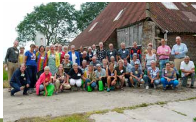
foto uit worddocumentpagina 15 met vrijwilligeers 2022

Een groot aantal vrijwilligers is actief bij Nijkleaster: meer dan 100. Zonder hen zouden alle activiteiten niet kunnen plaatsvinden. Vrijwilligers zijn o.m. betrokken als kleasterkracht op woensdag, vrijdag en zaterdag, tijdens de Programma's op Maat en bij het Nijkleaster Pinksterpaad. Bij de werkgroep fondsenwerving zijn vrijwilligers betrokken en ook zijn er in het verslagjaar 'kleasterklussers' gestart die voorbereidende werkzaamheden verrichten op het Westerhûs. Daarnaast zijn gast-voorgangers en pianisten actief bij het begeleiden van groepen tijdens de 'Kleasterkuier-moarn' op woensdag. Ook al konden de activiteiten niet steeds op volle kracht uitgevoerd worden, de betrokkenheid van de vele vrijwilligers was ook dit jaar hartverwarmend.