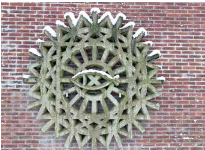
Jentsje Popma, De Hynstebloom / De Paardenbloem

'In 2013 schonk de kunstenaar Jentsje Popma zijn kunstwerk de Hynstebloom (de Paardenbloem) aan Nijkleaster. Dit kunstwerk is later verwerkt tot ons logo. Het verbeeldt een cirkel met een vis in het midden en een beweging vanuit het midden naar buiten toe. Het geel van een bloeiende paardenbloem wordt tot een witte pluizenbol waarvan de pluusjes zich tot in de verre omtrek verspreiden. De Hynstebloom vormt de basis van de kring van Nijkleaster. In het midden van het kunstwerk staat een vis (in het Grieks: Ichthus). Deze