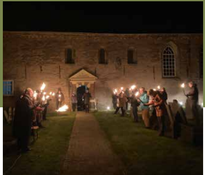
Paaswake 2021 (Paasochtend om 06.00 uur)

Nijkleaster organiseert programma's op maat voor groepen. Dat kunnen groepen zijn vanuit bijvoorbeeld bedrijven, kerken of scholen. In overleg met hen stelt Nijkleaster een