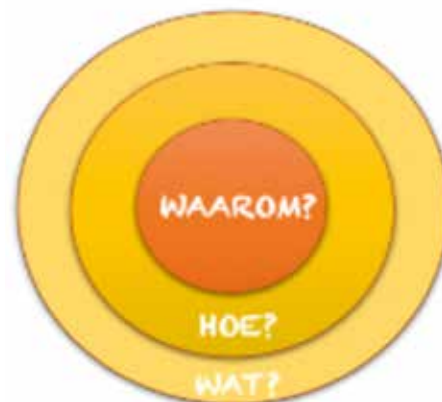
De gouden cirkel van Simon Sinek