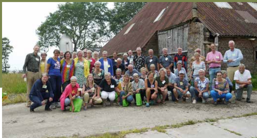
Het team van 2021