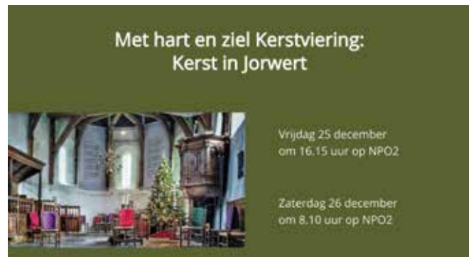
Kerst in Jorwert (KRO-NCRV, 25 december 2020)