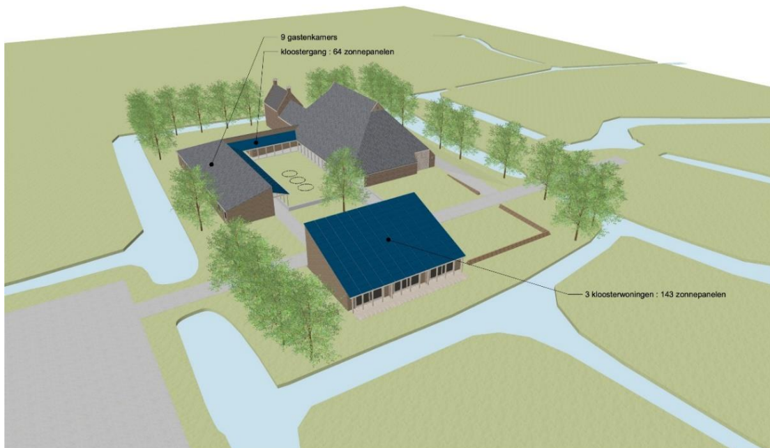
Tekening van Nijkleaster-Westerhûs met daarop aangegeven de meer dan 200 zonnecollectoren op de appartementen en de kloostergang. En de plaats van de watercontainers (3 cirkels in de binnentuin)