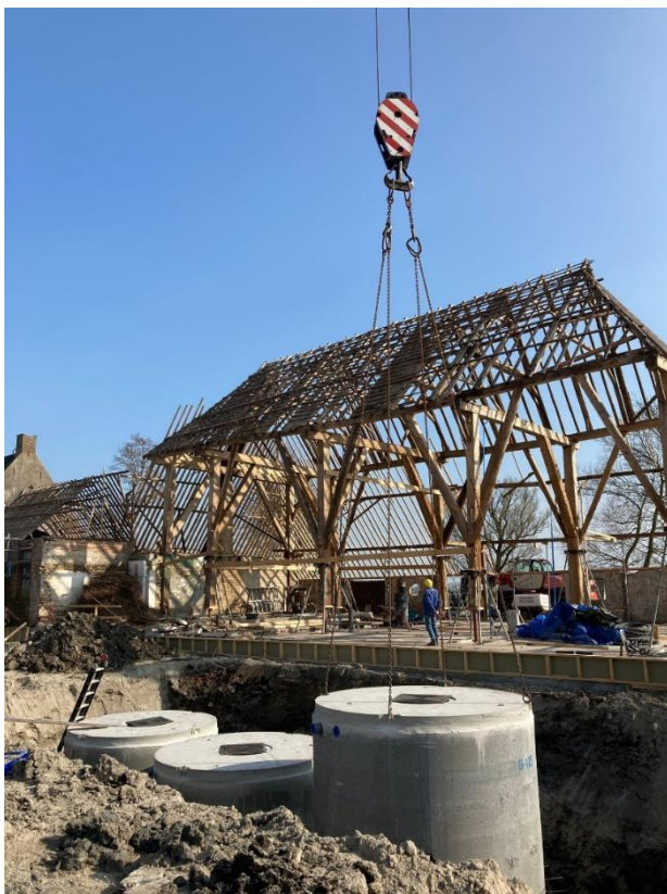
De watercontainers worden geplaatst op 30 maart 2022