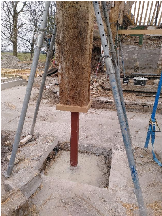
Mindervalide gebinten, maar steviger dan ooit

De bouw ligt goed op schema. De winter heeft niet geleid tot veel vorstverlet, maar het coronavirus is aan het bouw personeel niet voorbijgegaan. Er wordt nu hard gewerkt aan (1) het herstel van de houtconstructie, (2) de restauratie van de muren en gevels en (3) de nieuwbouw van kleaster-appartementen, gastenkamers en kantoren. En gaandeweg wordt nagedacht over de inrichting, het tuinontwerp, de inzet van vrijwilligers, over financiën en duurzaamheid en over het programma van de toekomst.