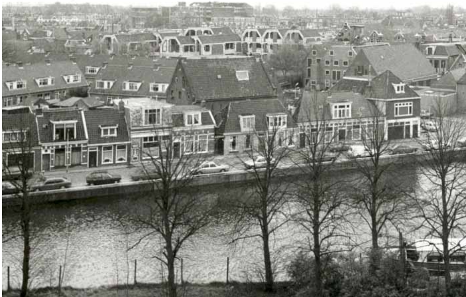
Het pakhuis in de Weerklank aan de Oostersingel, in het midden van de foto. Uitsnede van een foto uit 1982

In die jaren was Popma zeer actief als glazenier. In een zijruimte van het atelier heeft hij een klein venster met ganzen of fictieve zwemvogels in glasappliqué geplaatst dat er nog steeds te bewonderen is. In het atelier bevindt zich ook nog een verzameling van meer