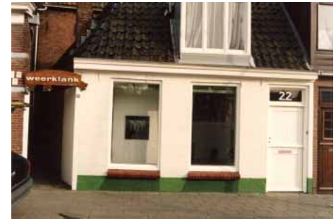
De toegang tot het atelier.