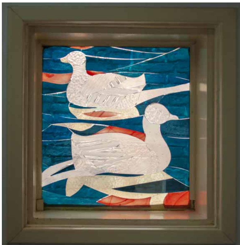
Venster met zwemvogels in glasappliqué.