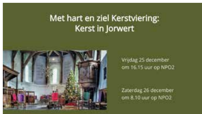
Kerst in Jorwert (KRO-NCRV, 25 december 2020)