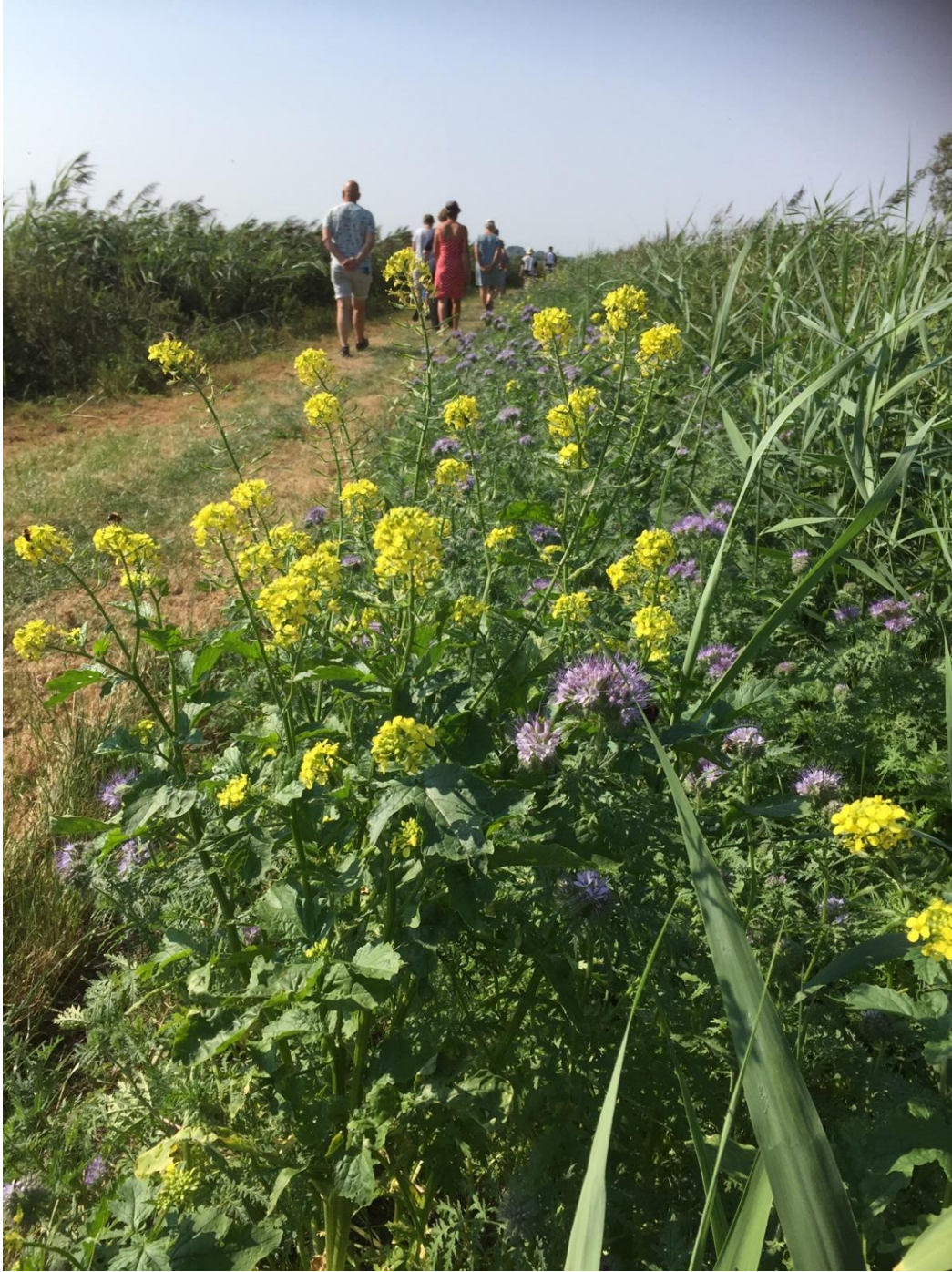
Bijen-flinterlint oan de Jaanfeart