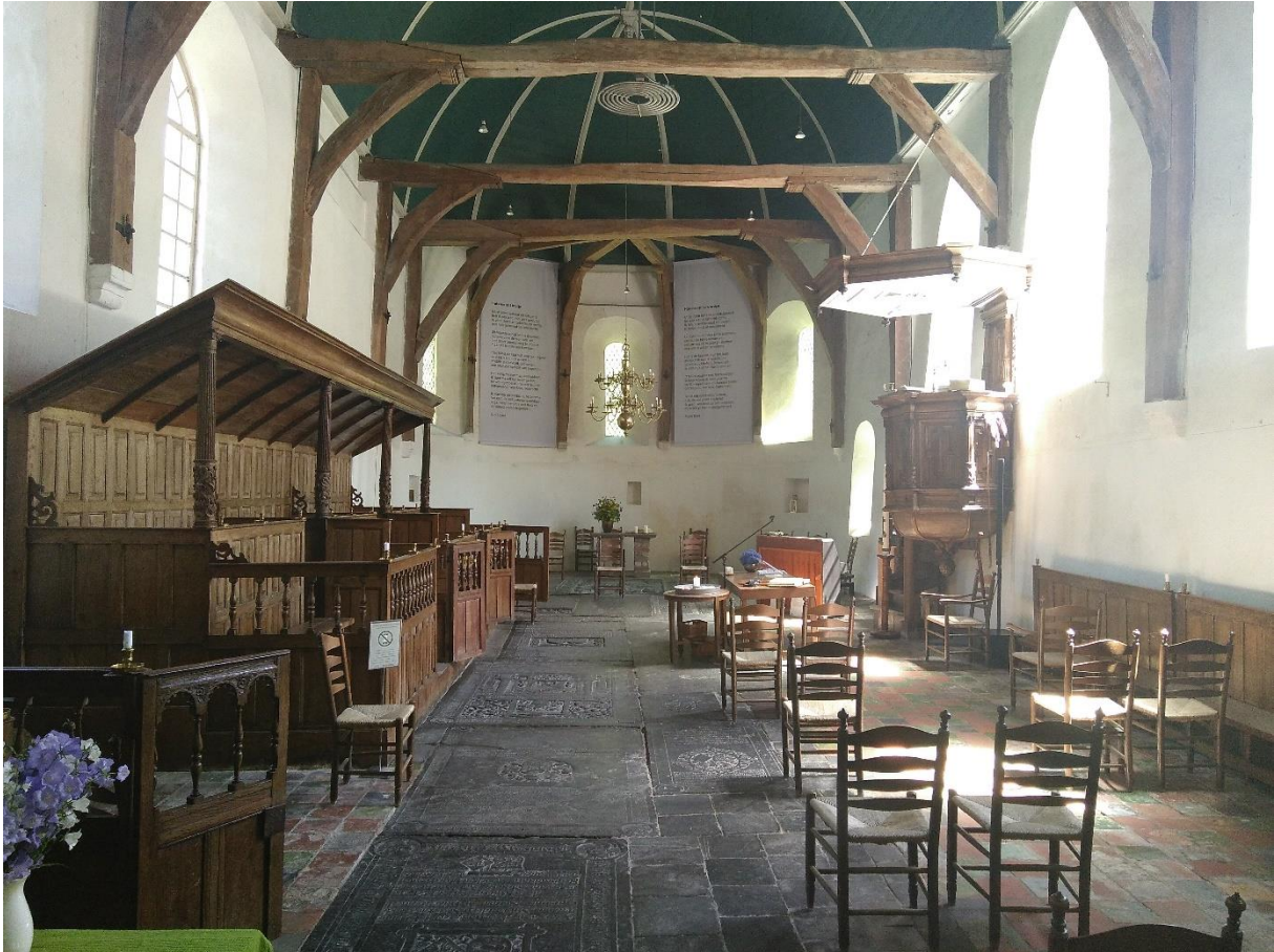
Kerk in corona-opstelling