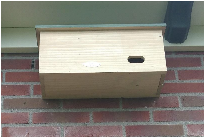
Nestkast voor een toerswel

In de middag hang ik een nestkast op voor een 'toerswel' (een gierzwaluw) aan de oostkant van onze pastorie op 4 meter hoogte. De andere nestkasten heb ik eerder al schoongemaakt en opgehangen. Het is wachten op de lente. In de middag zit ik van 14.00 - 16.00 uur in de kerk. Wat een weldadige stilte. Er branden een paar kaarsjes, maar in de middag komt er verder niemand. Ik doe mijn zangoefeningen in de kerk. Ha, hier klinkt het een stuk beter dan thuis. Daarna begin ik met de voorbereiding van een nieuw artikel. Heerlijk, daar ben ik lang niet aan toegekomen. Later meer hierover.