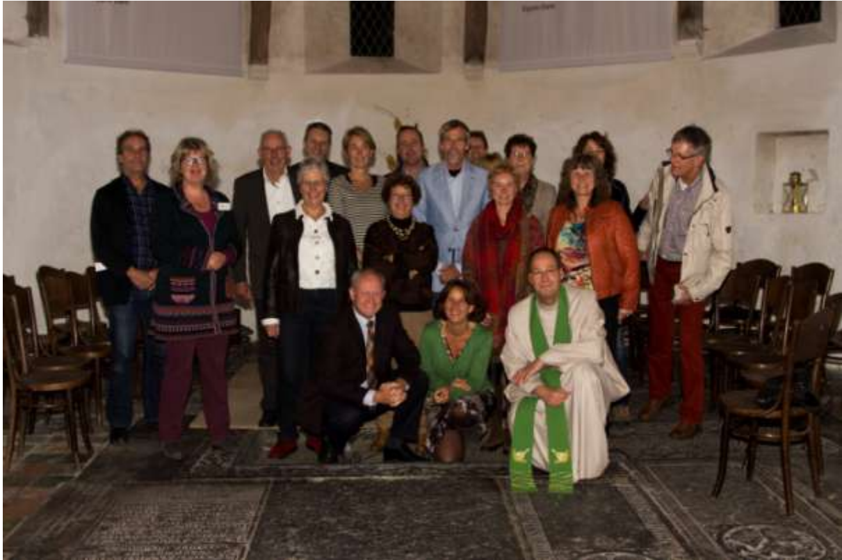
Een deel van de actieve Nijkleesterlingen op zondag 27 oktober 2013.