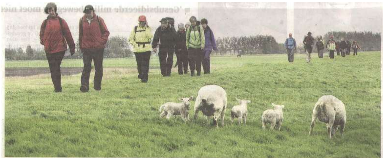
De driedaagse pelgrimage door Friesland wordt georganiseerd door Nijkleaster, een retraiteoord. Trouw 21/05/13